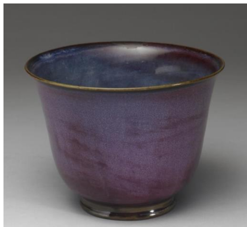
明 鈞窯 天藍窯變淺紫仰鐘式花盆