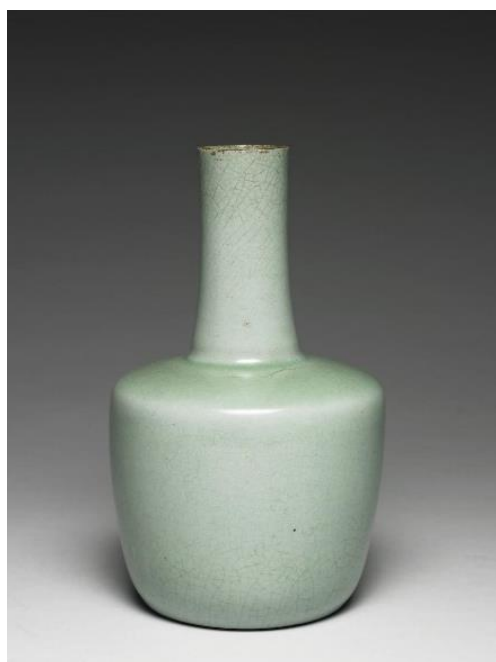
北宋 汝窯 青瓷紙槌瓶